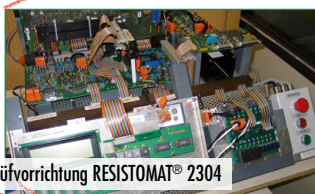
Prüfvorrichtung RESISTOMAT® 2304