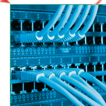
Typische Netzwerkverkabelung: Die Rechner im Unternehmen werden über Switch miteinander verbunden.