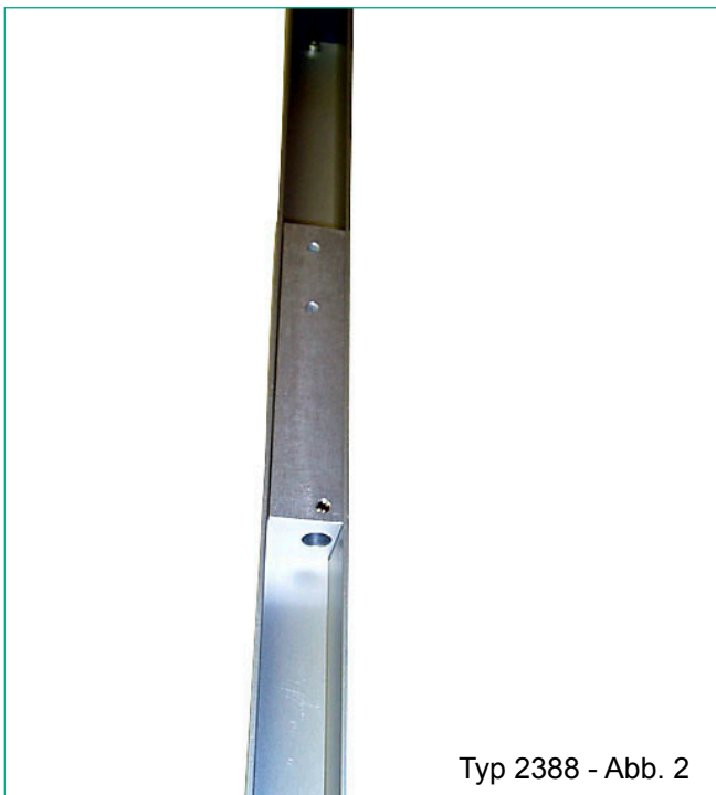
Typ 2388 - Abb. 2

An der Unterseite ist eine 6 mm Aufnahmebohrung für den Temperaturfühler 2392-V001 (Abb. 2).